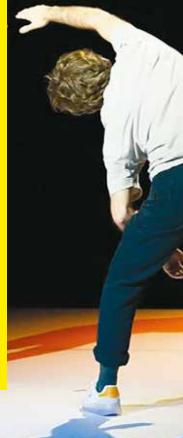
Et de se tenir la main

SÉANCES SCOLAIRES JEUDI 29 FÉVRIER 10H ET 14H30 VENDREDI 1 ER MARS 10H ET 14H30