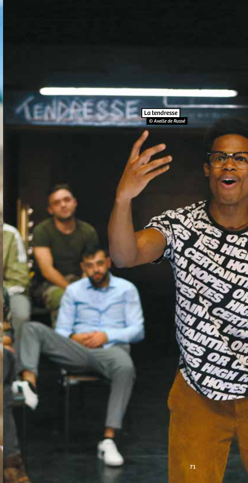
La tendresse