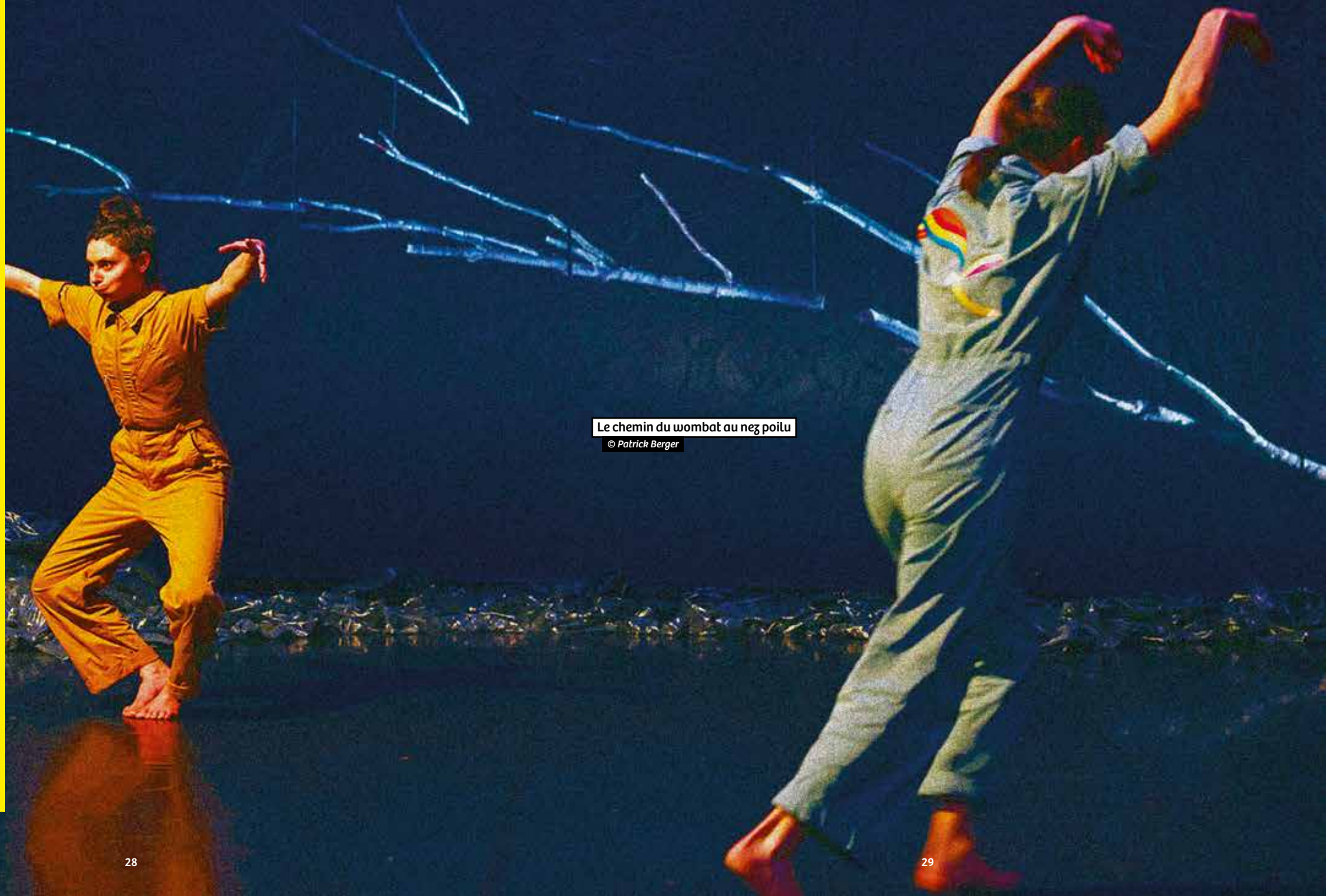
Le chemin du wombat au nez poilu

En partenariat avec Le Festival pour l'Enfance et La Jeunesse de Seine-Saint-Denis Playground