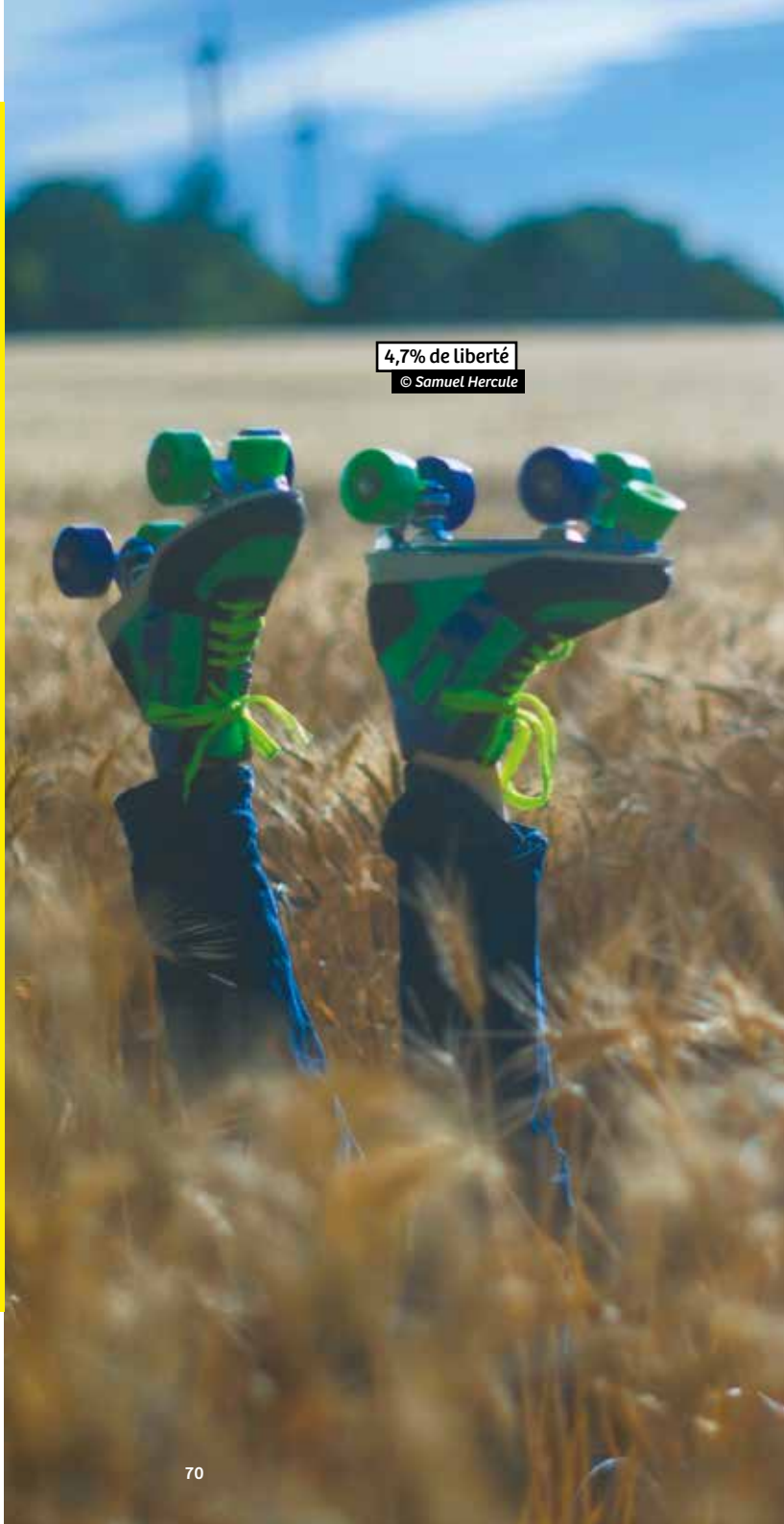
4,7% de liberté © Samuel Hercule

En partenariat avec Le Théâtre Nanterre-Amandiers