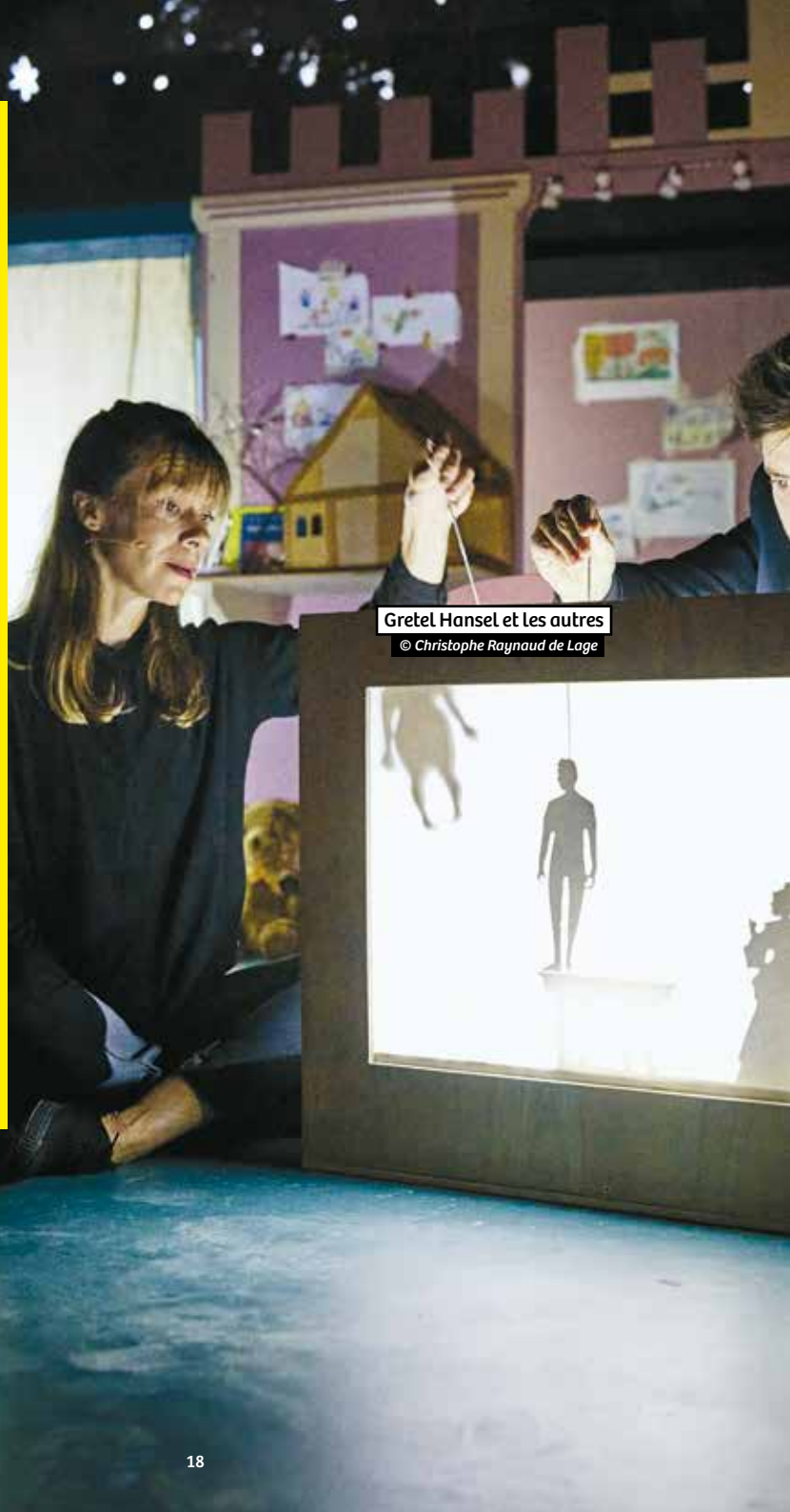
Gretel Hansel et les autres

SÉANCES SCOLAIRES JEUDI 5 OCTOBRE 10H ET 14H30 VENDREDI 6 OCTOBRE 14H30